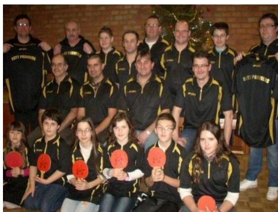
Remise des maillots.