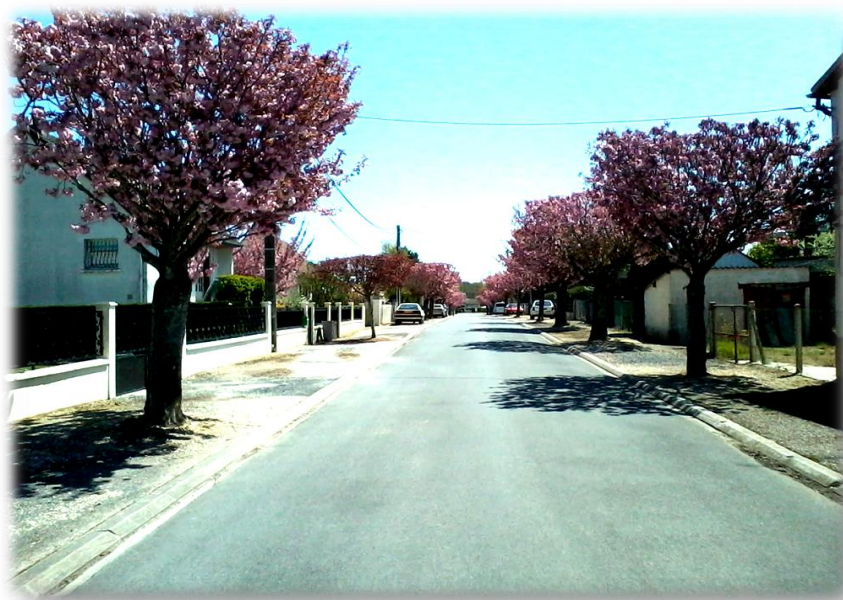
Rue des Chaumes