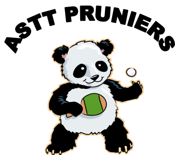
Association Sportive de Tennis de Table de Pruniers